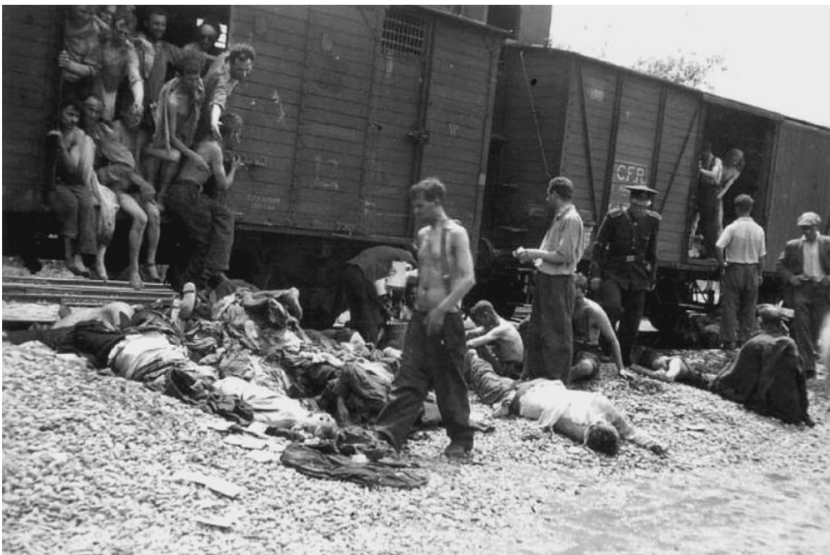
Жертви єврейського погрому в Яссах, 1941

Так чи інакше Джорджеску став першим за багато років видатним політичним діячем, який відкрито вступився за Кодряну в ефірі великого телеканалу, — повідомляє JTA . На цьому фоні характеристика Антонеску як «мученика», дана колишнім експертом ООН, не привернула такої пильної уваги.